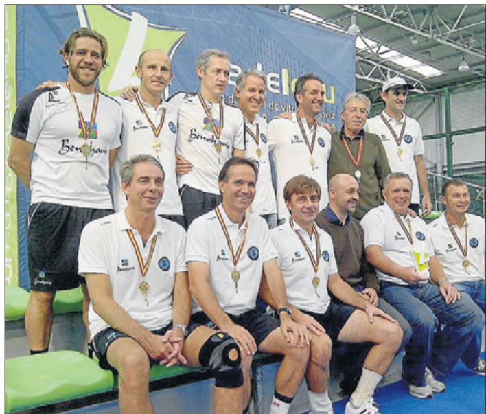
Los ganadores del Club Benahavís-Nueva Alcántara.