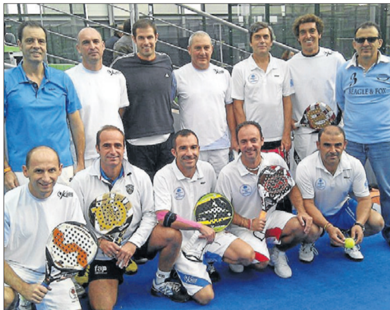
Los veteranos del Club Reserva del Higuerón. LA OPINIÓN