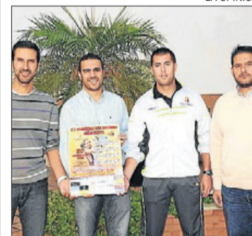
Los organizadores del torneo.